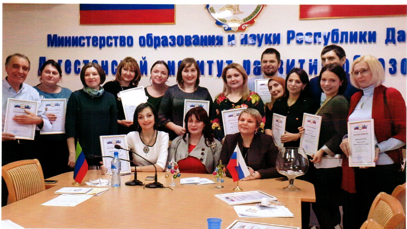
Заседание Ассоциации интерактивного образования РД